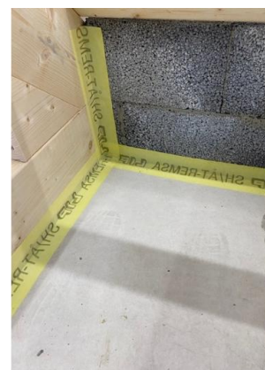
Revner over 3 mm med Armeringsnet