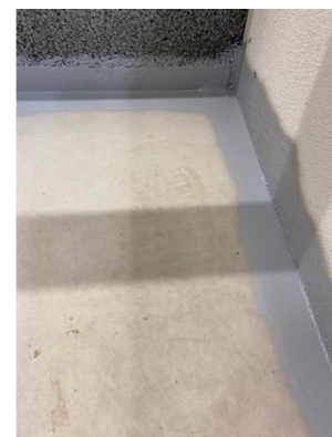
Revner op til 3 mm forsegles

Ved brug som Dampspærre skal membran påføres et minimums lag på 0,5 mm i tør tilstand. Påføres af minimum 2 gange af 0,5 mm våd tilstand total ca 1 mm = 0,5 mm i tør tilstand. Som Radonspærre skal der påføres minimum 1 mm i tør tilstand, påført minimum 2 gange. Der henvises til Bq/m 3 radon i undergrunden for nøjagtig tykkelse, geografisk bestemt. Påføringsvinkel ændres ved hvert lag. Lag tykkelse kontrolleres i tør tilstand, og der anbefales altid at der udføres en vedhæftningsprøve på eksisterende materiale på byggepladsen før projekter påbegyndes.