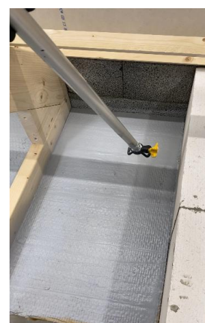
Membran påføres, to lag af minimum 0,5 mm pr. lag. tør Radonspærre